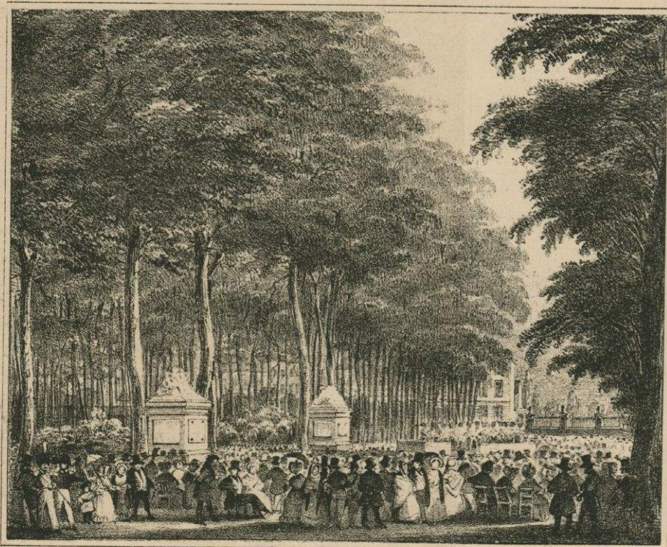
LE PARC A MIDI (1827).

La porte d'Anvers, que l'on désignait indifféremment sous le nom de porte de Laeken , avait été élevée, en 1820, sur l'emplacement de la porte Napoléon , d'après les plans de M. Suys. Sous le régime néerlandais on l'appela porte Guillaume . Elle était